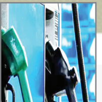
شاخه سبز- قیمت برق و قیمت بنزین آمریکا در ماه میلادی گذشته، افزایش شدیدی پیدا کرد و باعث شد تورم بخش انرژی از تورم کلی در این ماه فراتر برود.

به گزارش شاخه سبز، داده‌های اداره آمار کار آمریکا نشان داد قیمت انرژی که شامل برق، بنزین، نفت کوره و سایر محصولات و خدمات مرتبط به ۰.۴ درصد رشد داشت. قیمت انرژی در ۱۲